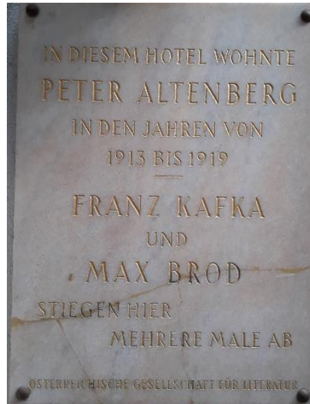
Gedenktafel an der Fassade des Graben Hotels